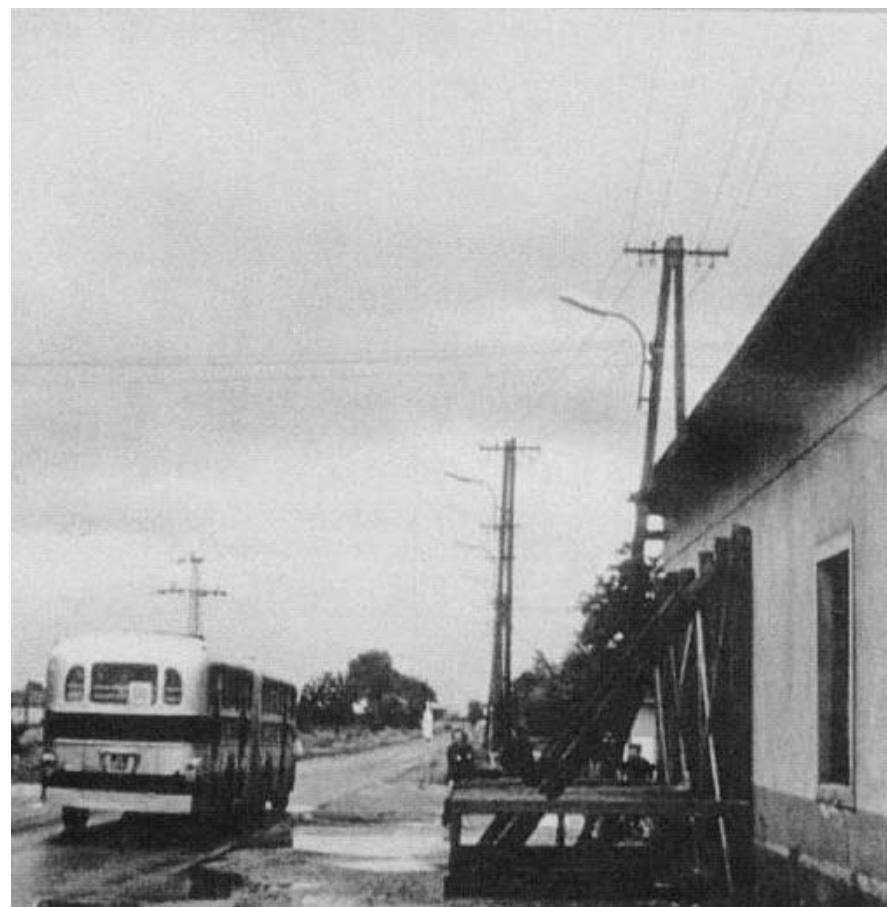
Halásztelki templom a 60-as években

A hetes szám szakrális szám. A teljesség, a szentség száma. Mozaik kövecskéim, ez a hét nem a teljesség, valamicske abból. Szent életről szólnak? Szentségre törekvésről biztosan.