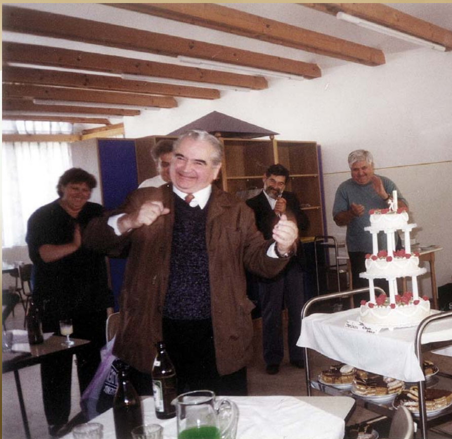
1997. utolsó együttlét a testvéreivel