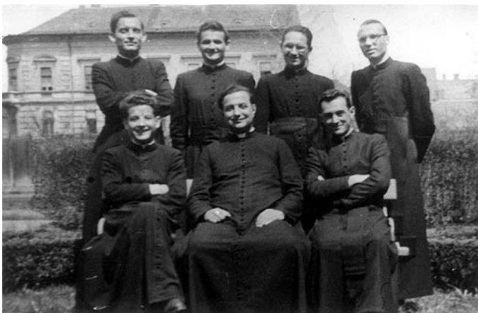
1953–1954: V. év teológia – Szeged

Szentelés: Székesfehérvár, 1954. június 27.