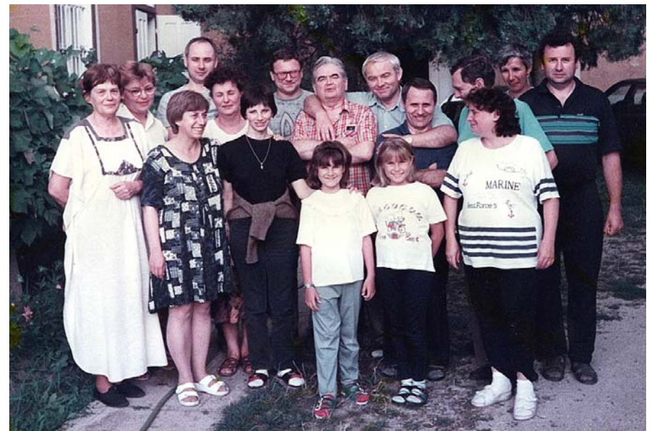
Lelki gyakorlat Berhidán