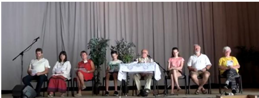
BNT 2024 – zárómise