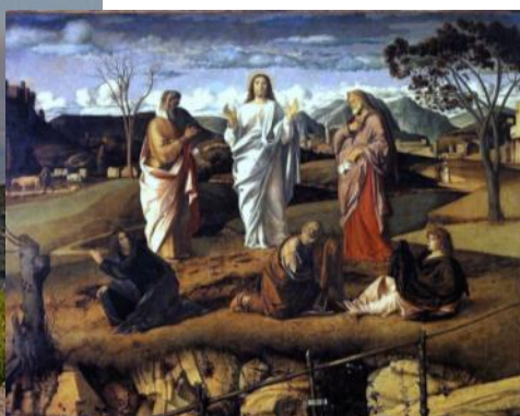
Bellini: Urunk színeváltozása (1490)