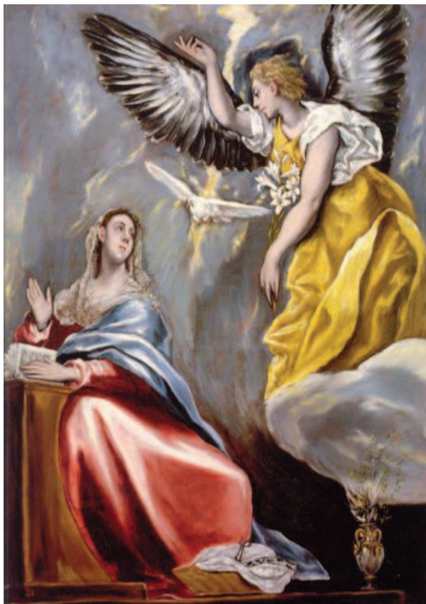
El Greco: Angyali üdvözet